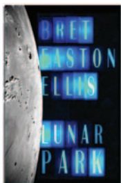
Bret Easton Ellis LUNAR PARK Alfred A. Knopf 2005