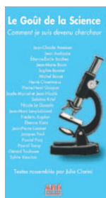
Textes rassemblés par Julie Clarini LE GOÛT DE LA SCIENCE, COMMENT JE SUIS DEVENU CHERCHEUR Alvik éditions 2005 16 euros