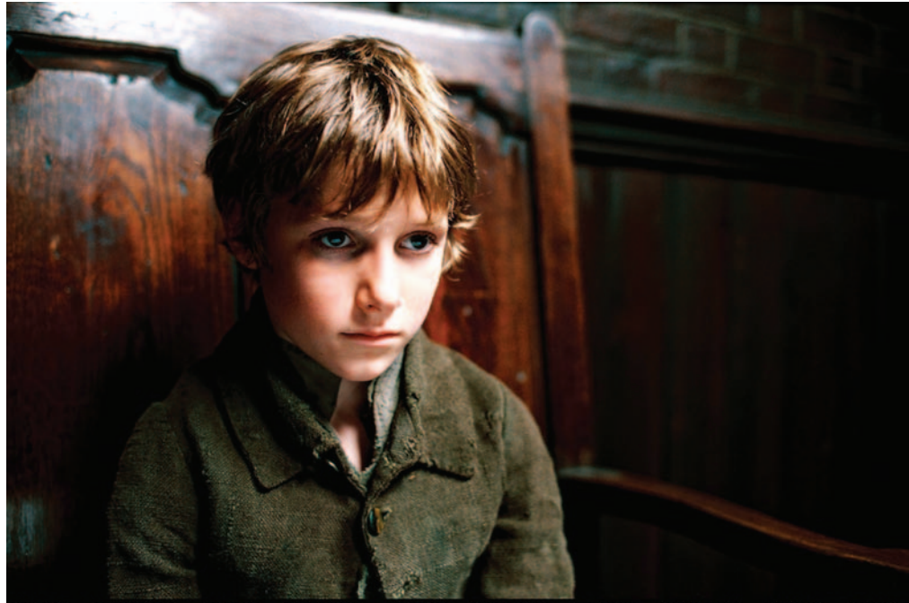
Image du film Oliver Twist , réalisé par Roman Polanski.

Il emploiera dès lors toute sa colère à dénoncer une société inhumaine envers les plus faibles. D'où l'abondance de portraits de l'enfance malheureuse, parangons de la vulnérabilité et de l'innocence massacrée. Parmi les faibles, on trouve aussi la population bigarrée des bas-fonds de Londres, ville d'élection de sa géographie romanesque. Dickens est